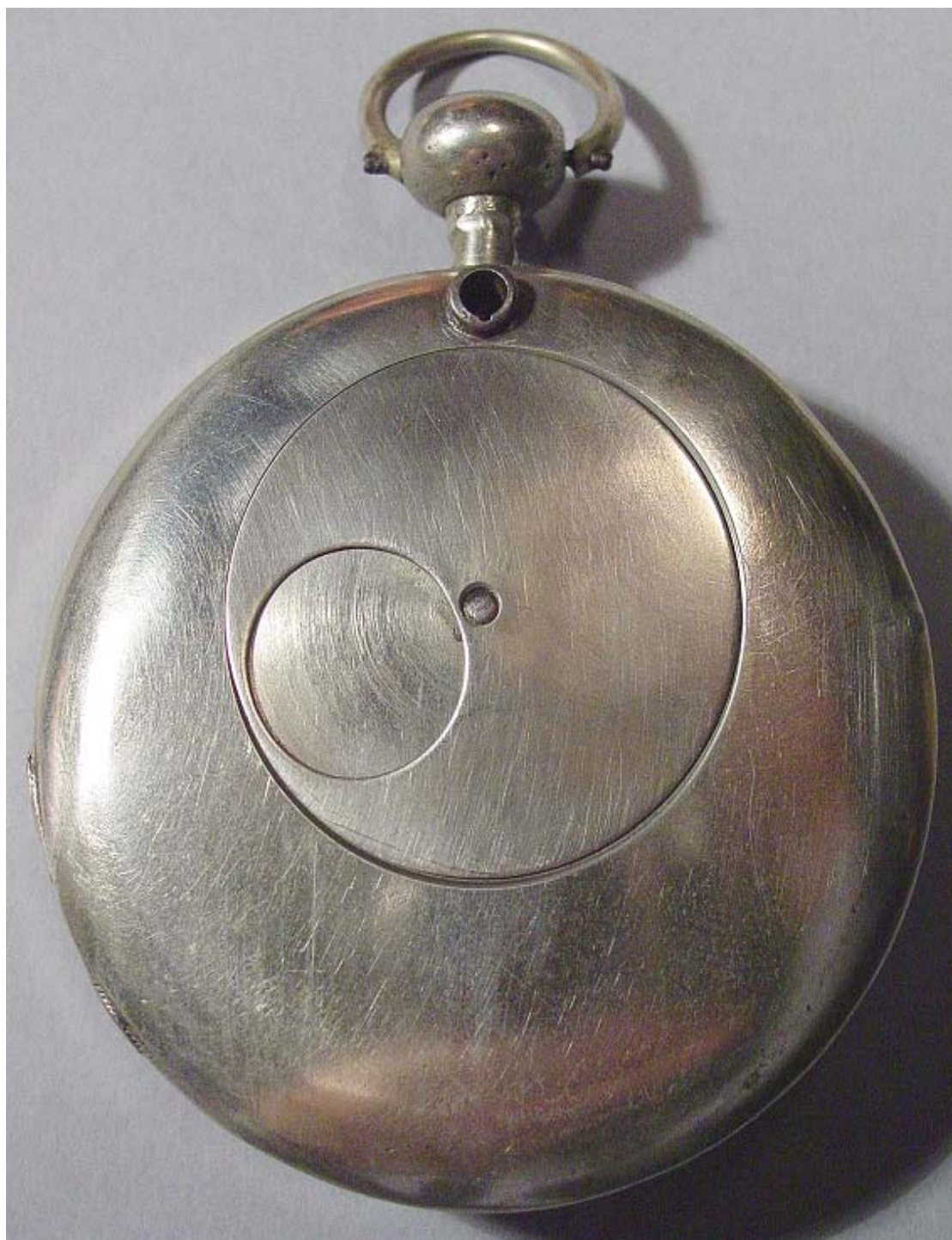
Abb. 4: Nolet-Uhr hinten

Nolet erhielt 1853 ein Patent für ein elektrisches Nebenuhrwerk und ein Jahr später hatte er 100 "lanternes-horloges" im Stadtgebiet von Gent installiert. Mit diesen in Straßenlaternen integrierten öffentlichen Uhren gilt Gent als eine der ersten europäischen Städte mit einer funktionierenden elektrischen Uhrenanlage.