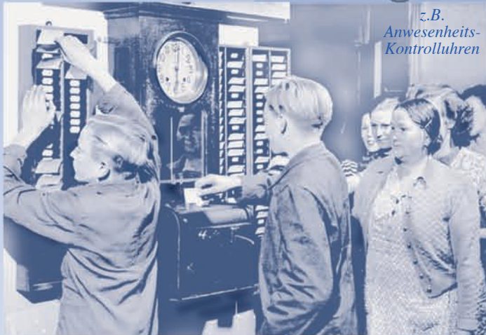
z.B. Anwesenheits- Kontrolluhren