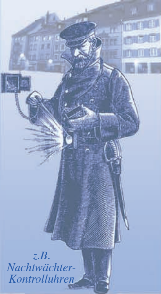
z.B. Nachtwächter- Kontrolluhren